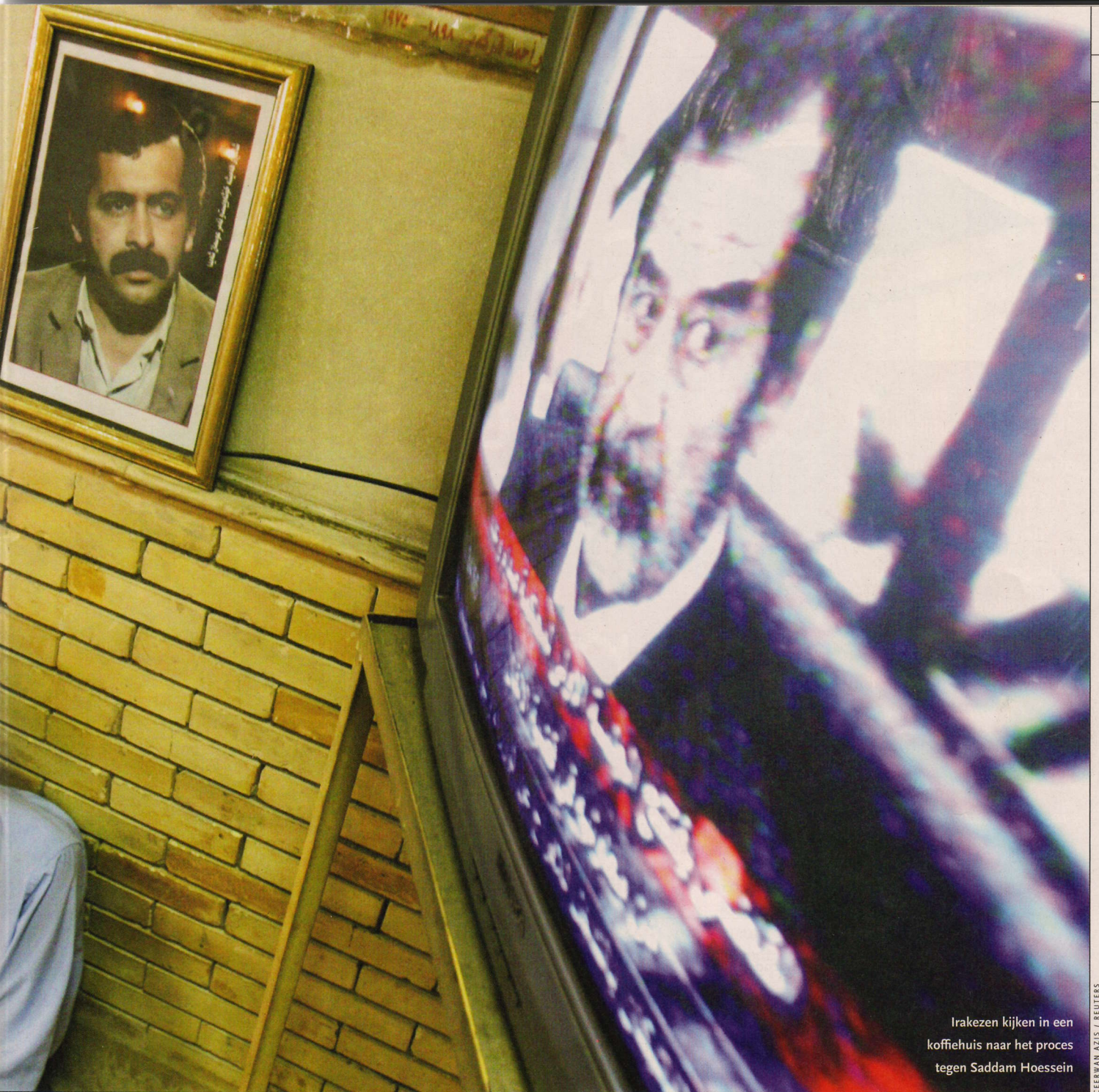
Irakezen kijken in een koffiehuis naar het proces tegen Saddam Hoessein