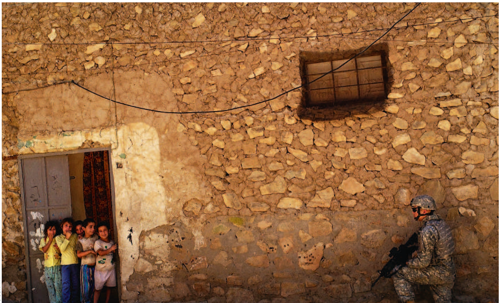
Een Amerikaanse soldaat patrouilleert in een wijk in Bagdad.