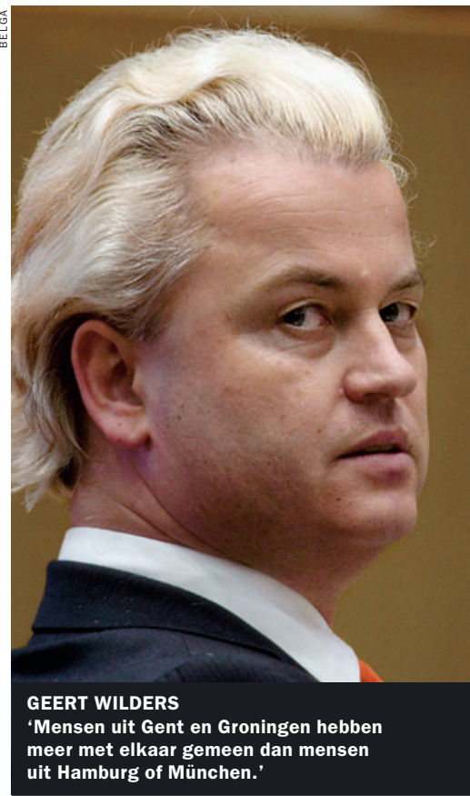
GEERT WILDERS 'Mensen uit Gent en Groningen hebben meer met elkaar gemeen dan mensen uit Hamburg of München.'

Wilders' geblondeerde haren verraden de wortels van zijn karakter: gedurfd, controversieel, provocatief. Maar achter het eigengereide voorkomen gaat een hartelijke gastheer schuil; charmant, geïnteresseerd en voorkomend in zijn donkere pak en gelakte Italiaanse schoenen. Een ogenschijnlijke tegenstrijdigheid die ook zijn boude uitspraken typeren. Wilders vindt de islam een fascistische ideologie, bestempelt moskeeën als haatpaleizen en wil de Koran graag verbieden, maar bezweert vervolgens niets tegen moslims te hebben. Een gekunsteld onderscheid, vinden zijn politieke tegenstanders. Het Openbaar Ministerie oordeelde anders en vond dat een gezonde rechtsstaat wel tegen een stootje van Wilders moet kunnen. Peilingen voorspellen dat de PVV haar opmars voortzet in een verder versnipperend Nederlands politiek landschap. Met die groeiende macht in het vooruitzicht wil Wilders zijn PVV breder op de politieke kaart zetten. Hoog tijd voor een gesprek. U hebt maandenlang aan een plan gewerkt voor 16 miljard euro lastenverlaging. De belangstelling was beperkt, om het mild uit te drukken.