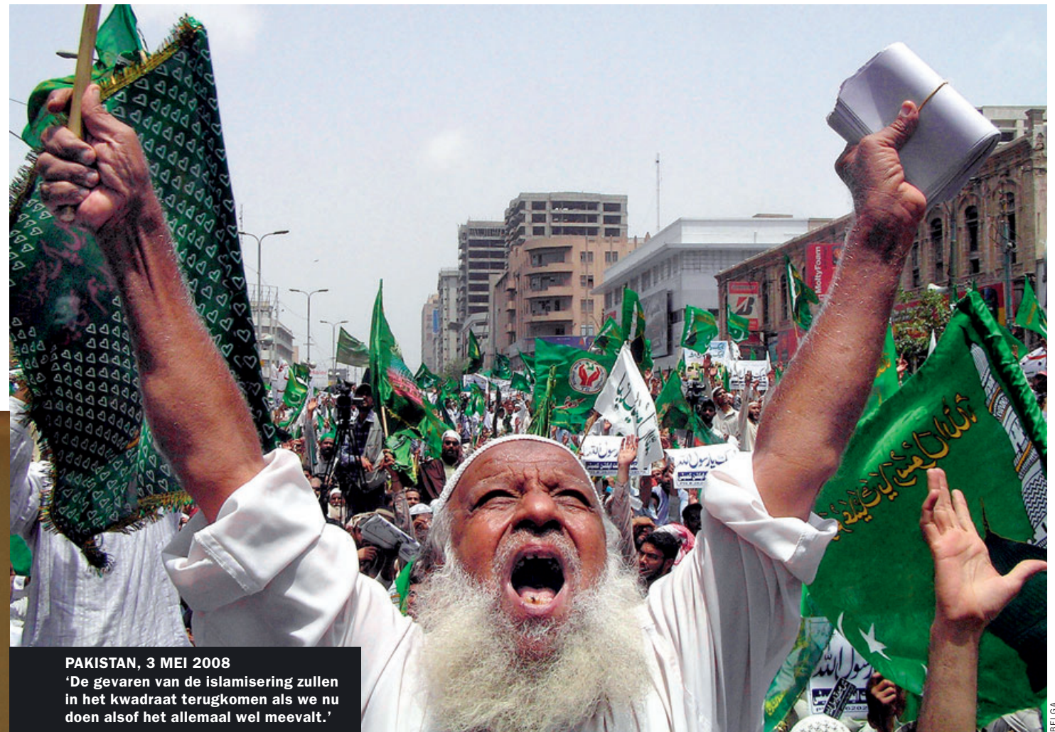
PAKISTAN, 3 MEI 2008 'De gevaren van de islamisering zullen in het kwadraat terugkomen als we nu doen alsof het allemaal wel meevalt.'

GEERT WILDERS: (grijnst) Ik heb ook een plan voor politie en justitie gepresenteerd. Toen zaten er een stagiaire van het Gronings Dagblad en iemand van een persbureau op de persconferentie. Heel frustrerend. Als ik vanuit de auto vragen stel over een moskee, staan ze morgen op de voorpagina. Daar heb ik dan twintig seconden aan gewerkt. Werken we drie maanden aan een plan om de files te bestrijden, dan komt niemand luisteren.