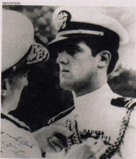
OORLOGSHELD. Kerry krijgt een medaille voor zijn dienst in de Vietnamoorlog.