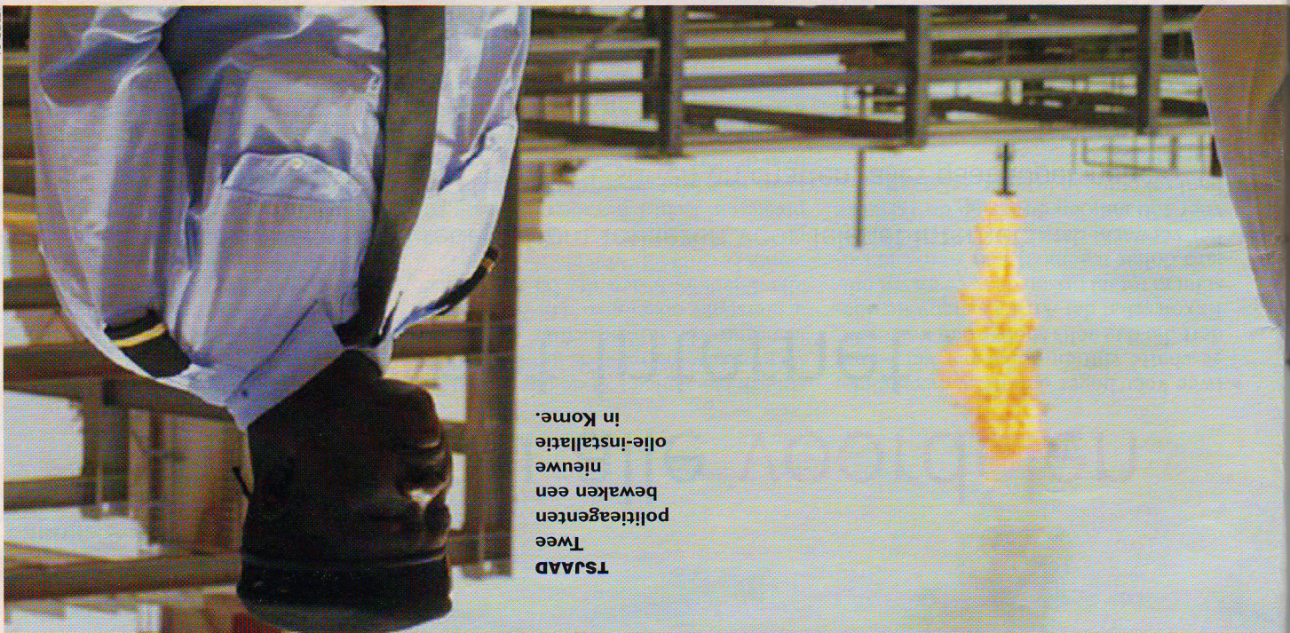
Tsjaad Twee politieagenten bewaken een nieuwe olie-installatie in kome.

der het oog van de VN zou Saddam ma van de Verenigde Naties in Irak. On- denken aan het Oil-for-Food -program- De overeenkomst doet immers sterk 'zand', oordeelden Afrika-deskundigen. 'De Wereldbank steekt z'n kop in het eind 1998 akkoord. zitten, verklaarde het parlement zich lang in de Tsjadische bodem zou blijven ken. Beseffend dat de olie anders nog dan zou de Wereldbank zich terugtrek-