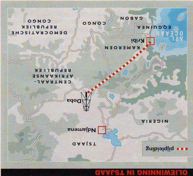
OLEWINNING IN TJSJAD

Zo ligt de pijpleiding veilig een meter ondergronds. Een dure oplossing. Mensen die langs het traject van de pijpleiding wonen, moesten worden gecompenseerd